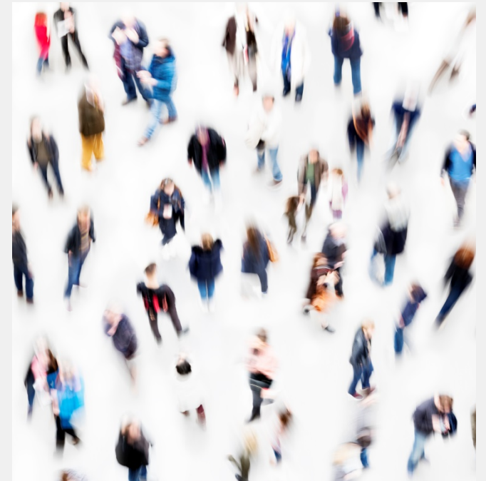
Locatiegegevens mobiele telefoon