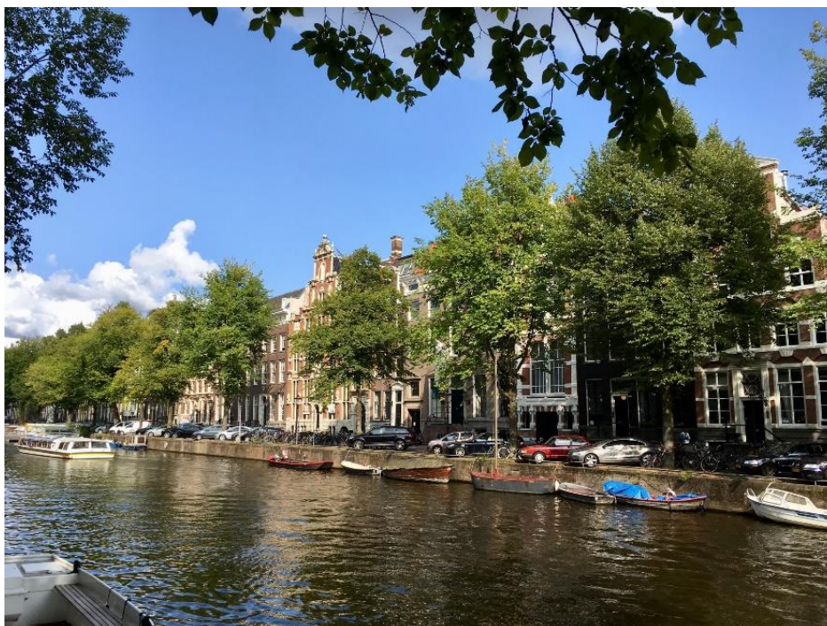
Kantoorlocatie Privacy First aan de Keizersgracht, Amsterdam.

Begin 2019 zijn de statuten van Privacy First vrijwel volledig herzien en geactualiseerd. Tevens heeft Privacy First een nieuw reglement voor onze Raad van Advies opgesteld. Dit gebeurde met pro bono ondersteuning door het advocatenkantoor Nauta Dutilh, via Pro Bono Connect.