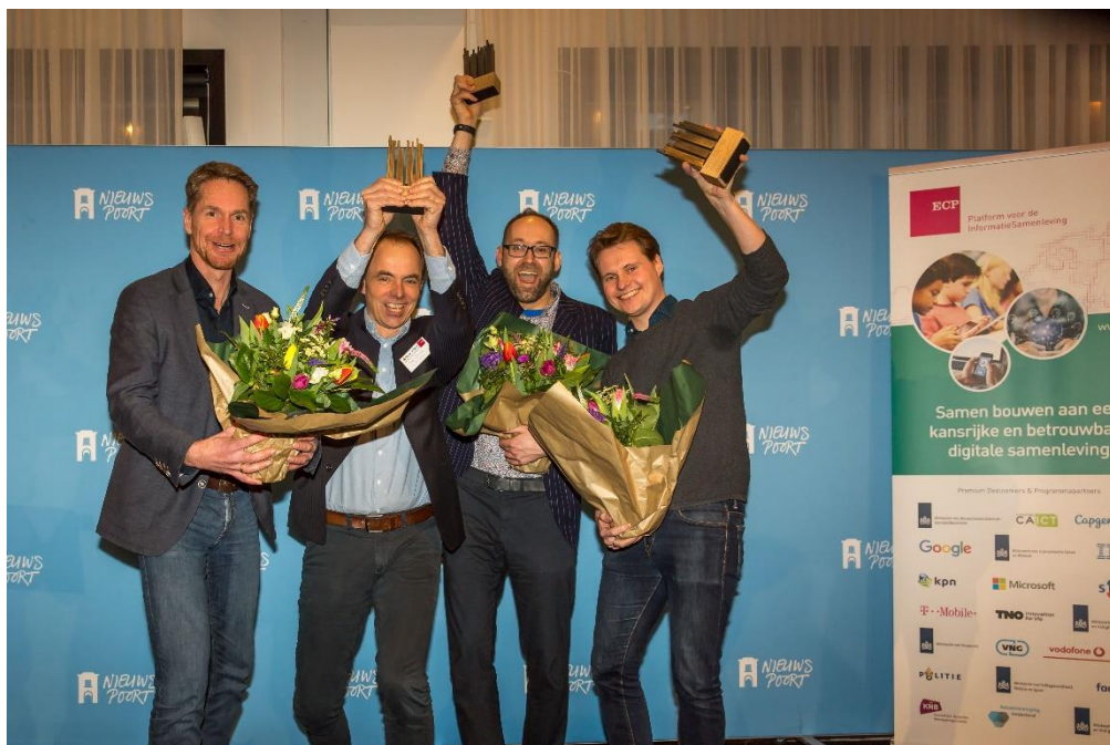
Winnaars Nederlandse Privacy Awards 2020.