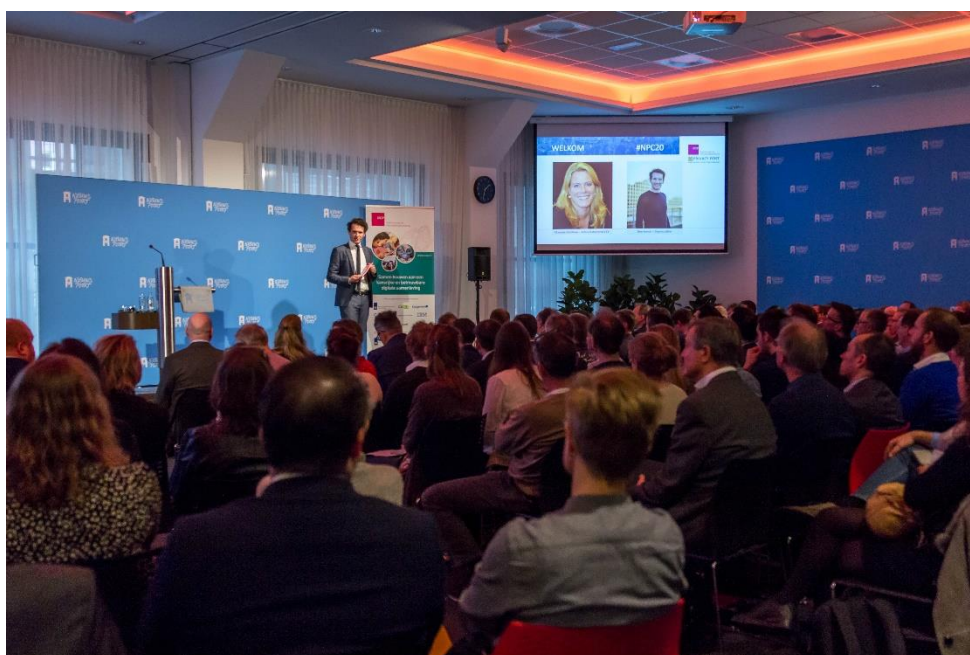
Nationale Privacy Conferentie, Nieuwspoor 28 januari 2020.

Op 28 januari 2020 organiseerden ECP en Privacy First opnieuw gezamenlijk onze jaarlijkse Nationale Privacy Conferentie. Dit is inmiddels hét jaarlijkse Nederlandse privacy-evenement rond de Europese Dag van de Privacy. Ons doel van dit evenement is om gezamenlijk met het bedrijfsleven, de overheid en wetenschap te bouwen aan een privacyvriendelijke informatiemaatschappij en Nederland te ontwikkelen tot internationaal Privacy Gidsland. De congreslocatie was Nieuwspoor in Den Haag en de belangstelling bleek weer enorm: 220 professionals hadden zich aangemeld, met een zaalcapaciteit van 160 personen, oftewel een bomvolle zaal waarin sommigen zelfs moesten staan. Keynote speakers tijdens het congres waren achtereenvolgens Monique Verdier (vice-voorzitter Autoriteit Persoonsgegevens), Richard van Hooijdonk (trendwatcher/futurist) en Bas Filippini (oprichter en voorzitter van Privacy First), Tom Vreeburg (IT-auditor), Coen Steenhuisen (privacy adviseur Privacy Company), Peter Fleischer (global privacy counsel bij Google) en Sander Klous (hoogleraar Big Data Ecosystemen, Universiteit van Amsterdam). Dagvoorzitter was presentator Tom Jessen (RTL, BNR).