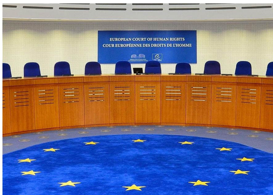
Europees Hof voor de Rechten van de Mens.