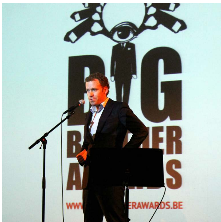
Toespraak Privacy First bij de Belgische Big Brother Awards (30 mei 2013, Gent)